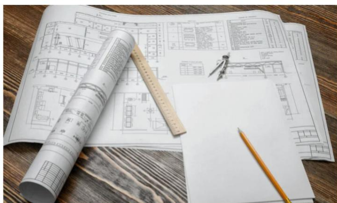
Salva Casa: Foto: Aleksandr Elesin 123RF.com

17/06/2024 - Il Salva Casa non convince i professionisti tecnici che, pur considerando necessarie alcune semplificazioni, nutrono dubbi sulle eccessive responsabilità a carico dei professionisti, sulle tolleranze costruttive e sui cambi di destinazione d'uso.